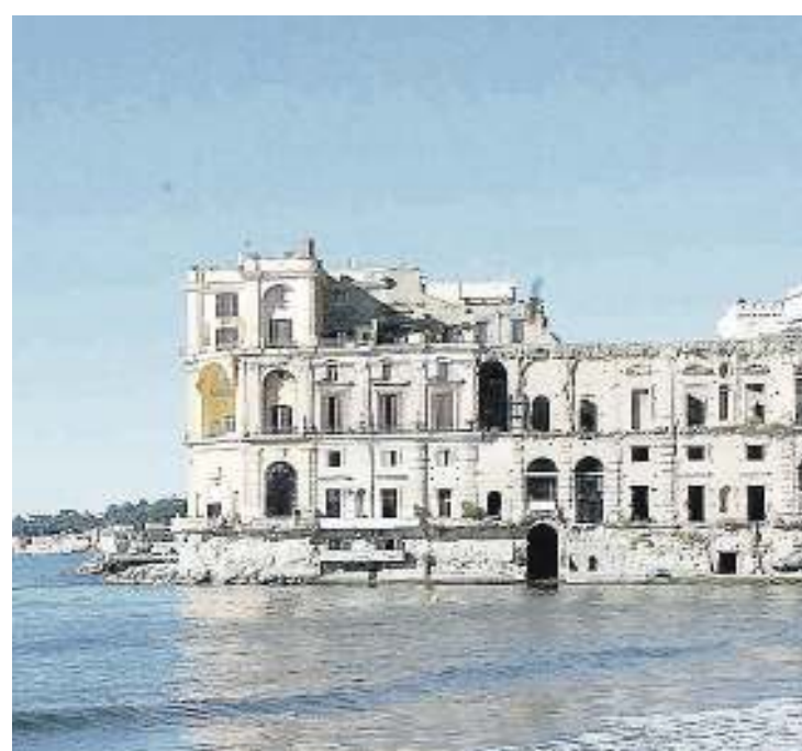
PORTE APERTE Palazzo Donn'Anna a Posillipo